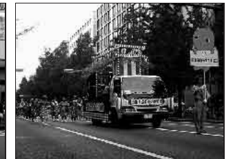
昨年の御堂筋パレード風景